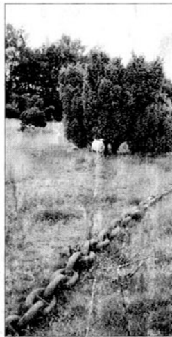
Heide-Gräberhügel, gesichert mit 270 m langer Ankerkette: Das garantiert dem Kulturdenkmal die angemessene Ruhe.

Um Ilya Kabakovs Arbeit zu entdecken, wandert oder radelt man von Laar, einem der vielen properen Dörfer, deren weiße Giebel und Windmühlen schon das Gefühl geben, einwandern in den Niederlanden zu